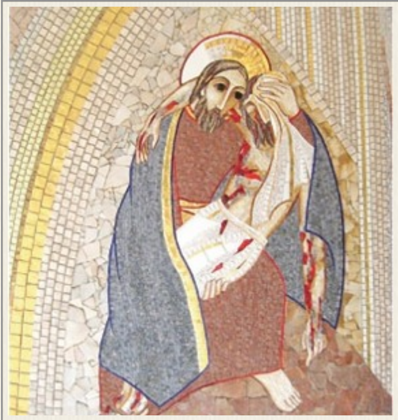
Marko Ivan Rupnik, Il buon samaritano, Chiesa Parrocchiale Sant'Eusebio

1. Le vie del Signore sono oscure, ma sempre di salvezza per noi, perché tutto quello che da Lui viene è un bene.